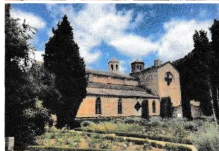
Abbaye de Fontfroide